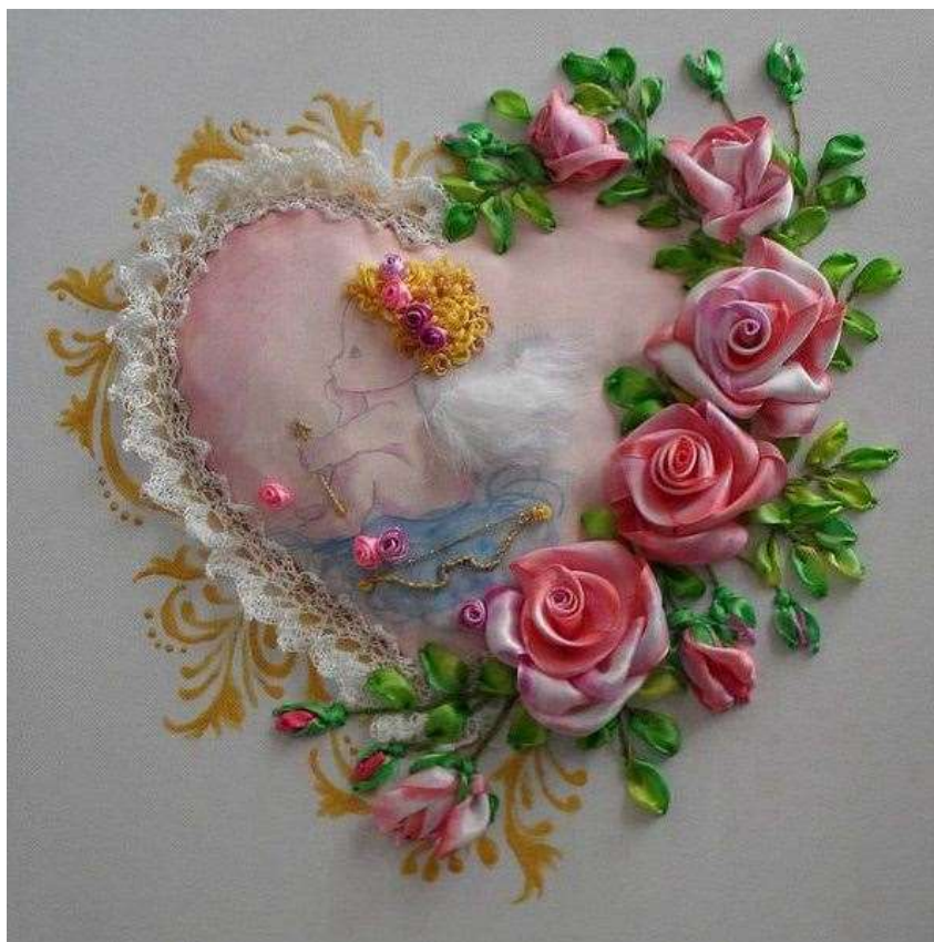
Вышивка лентами. «Сердце».