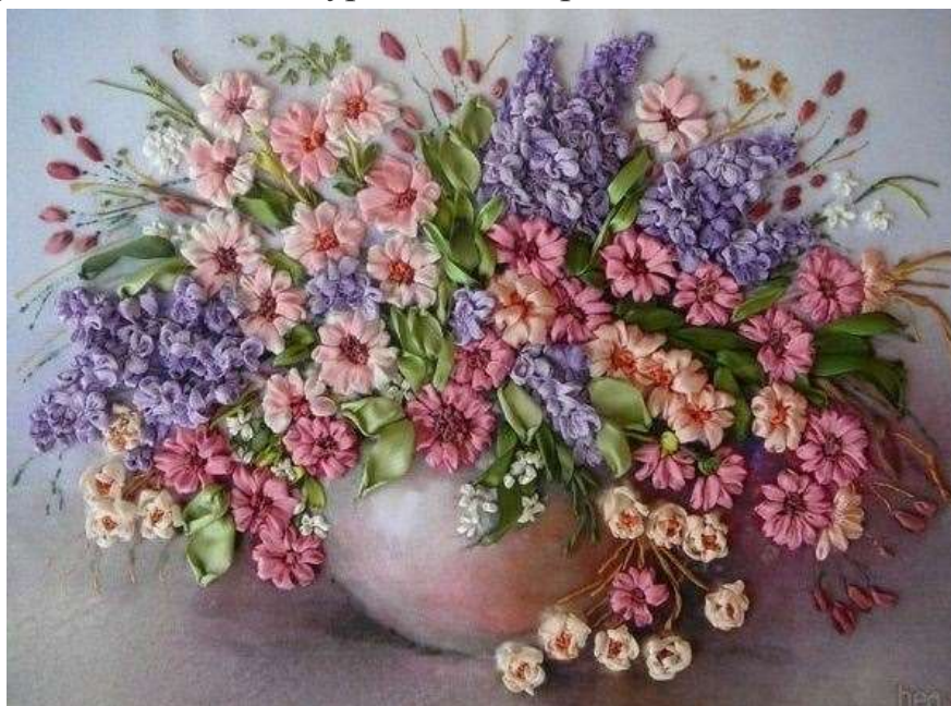
«Ваза с цветами» — вышивка лентами

В процессе работы опытные рукодельницы умело комбинируют большое количество разновидностей стежков и шелковых лент разной ширины. Это дает возможность создавать оригинальные изделия, характеризующиеся высоким уровнем декоративности.