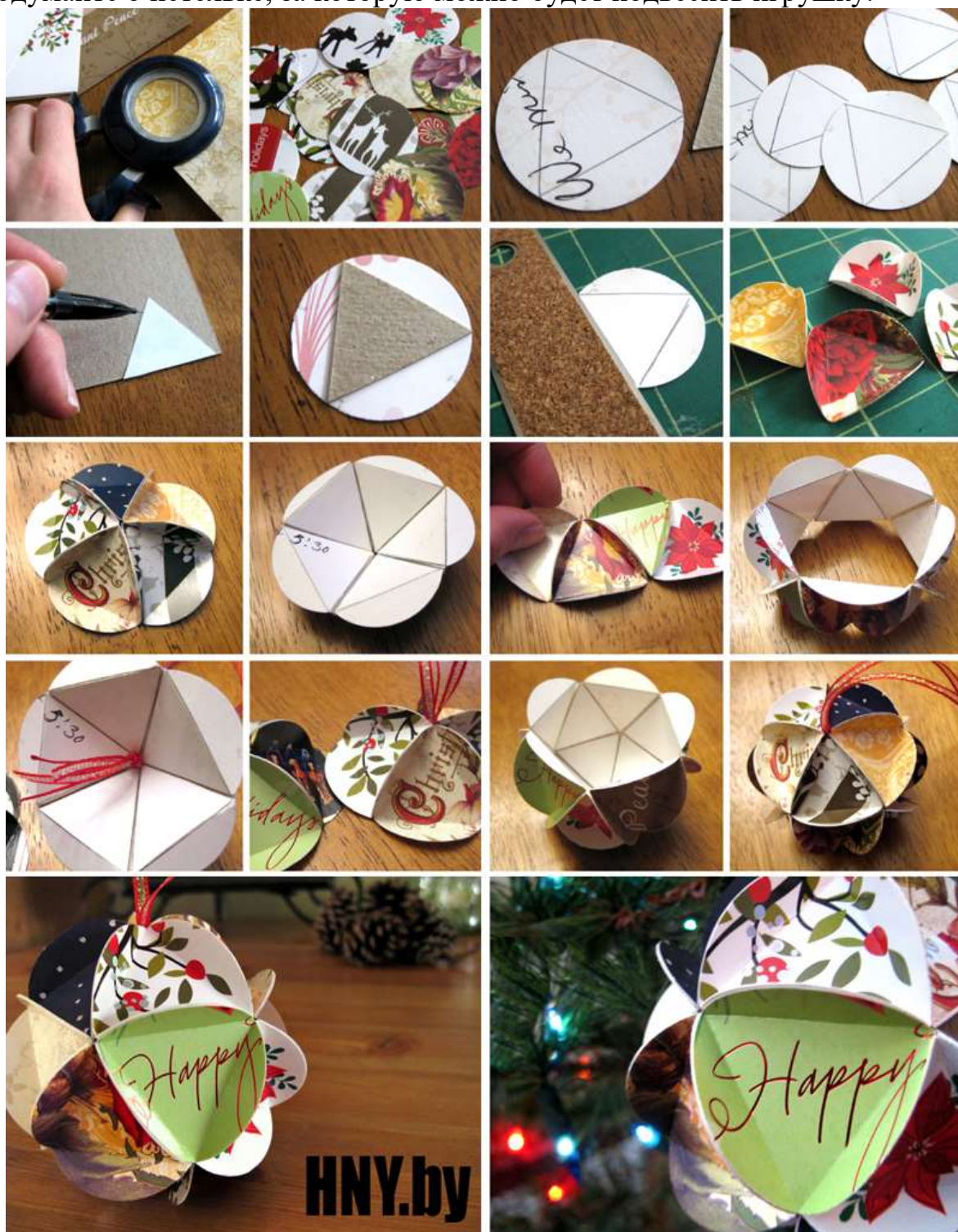
Новогодний шар из плотной бумаги

Верхнюю и нижнюю крышку предстоит приклеить к основе точно так же. Подумайте о петельке, за которую можно будет повесить игрушку.